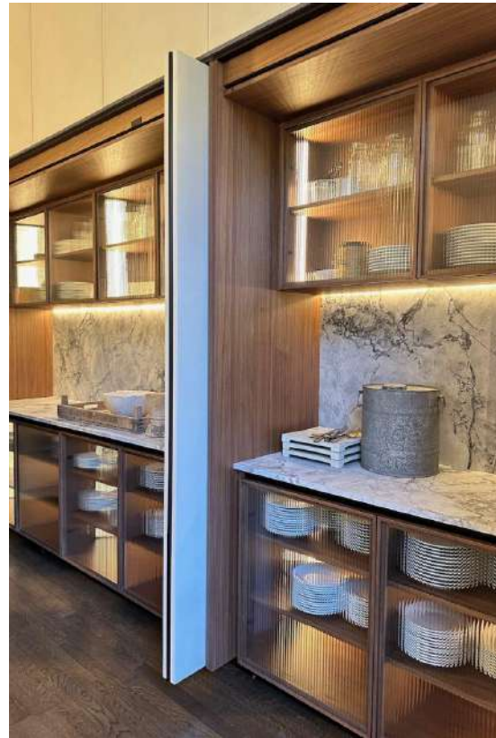
Rangements cachés derrière des portes escamotables