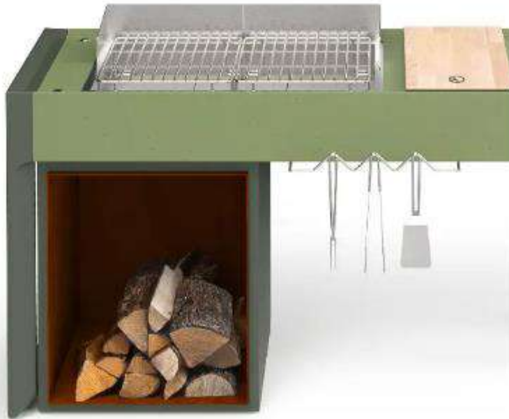
Camping, minimalisme Bois, acier