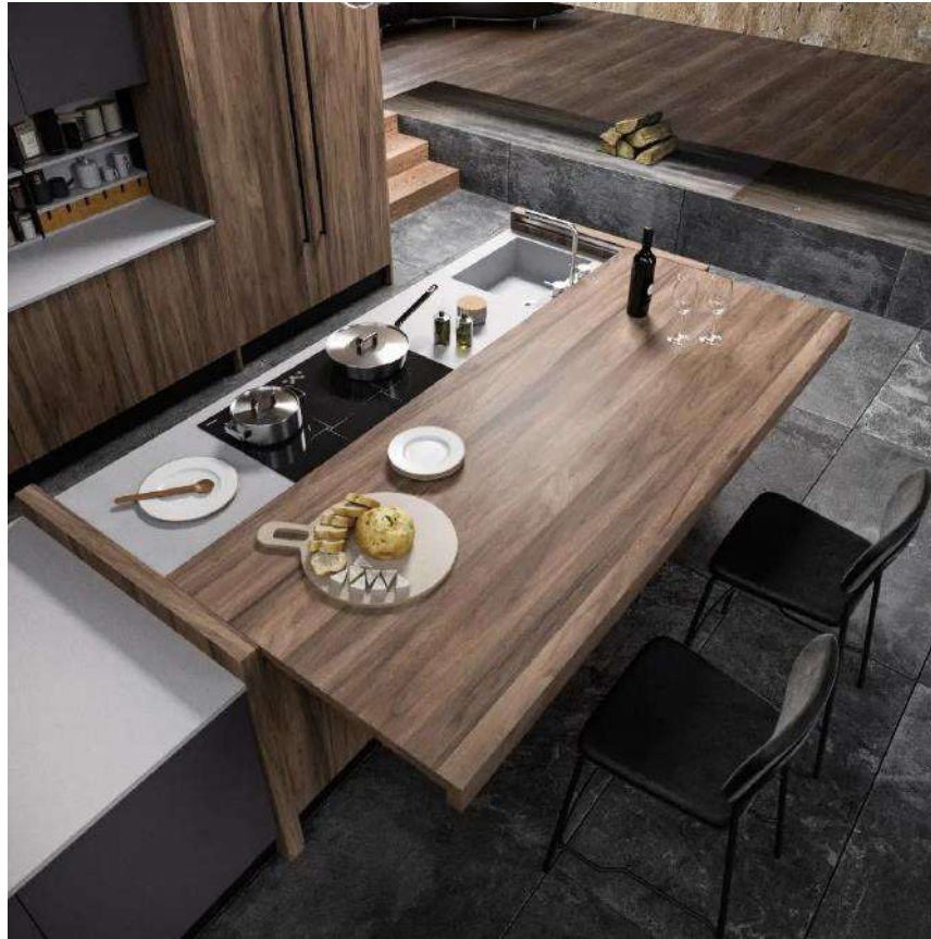
PLAN TABLE COULISSANT