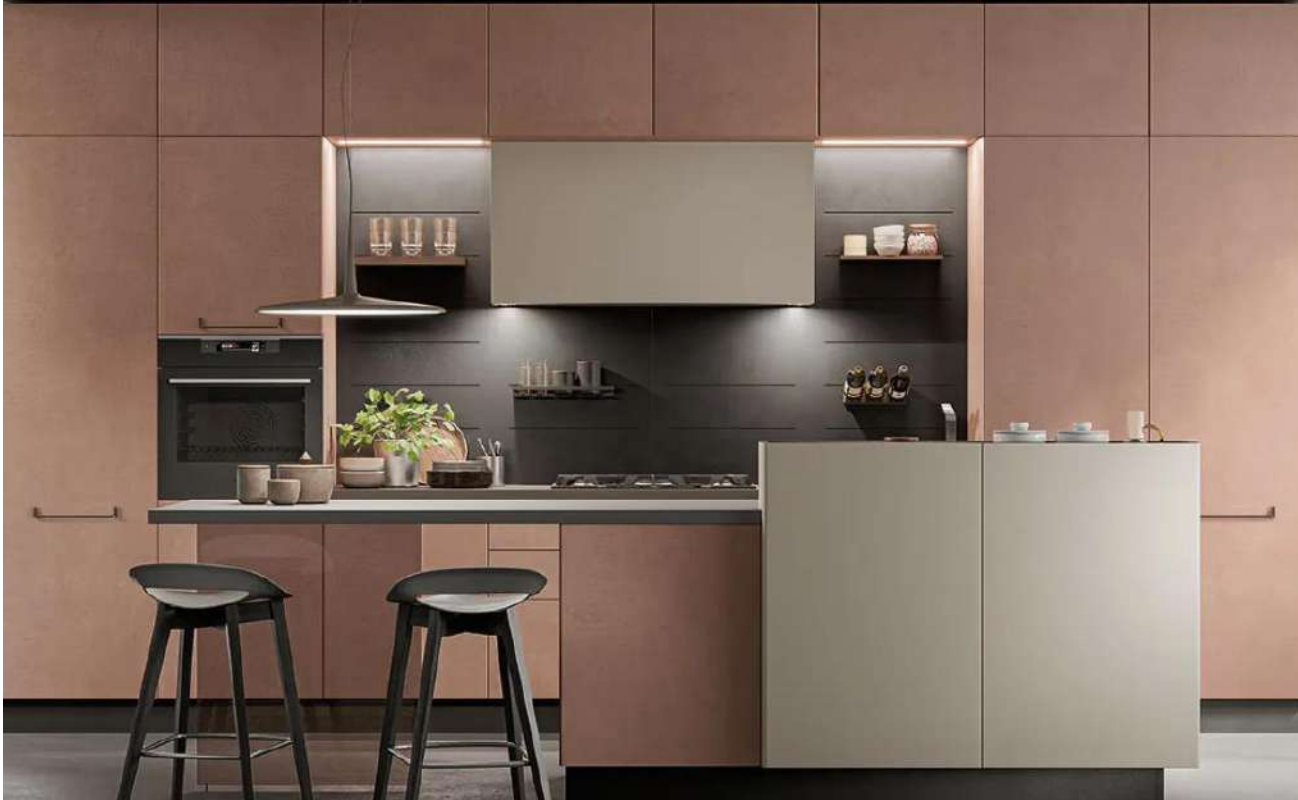
Coloris rose poudré