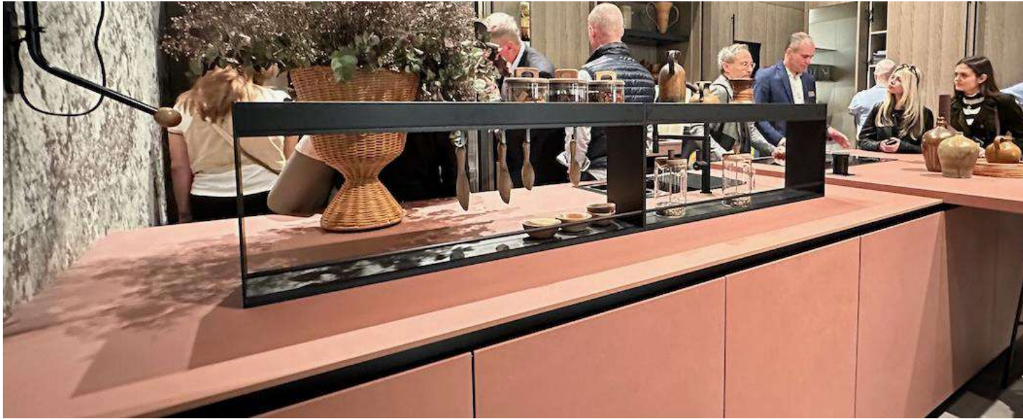
Coloris rose poudré, marbre rose.